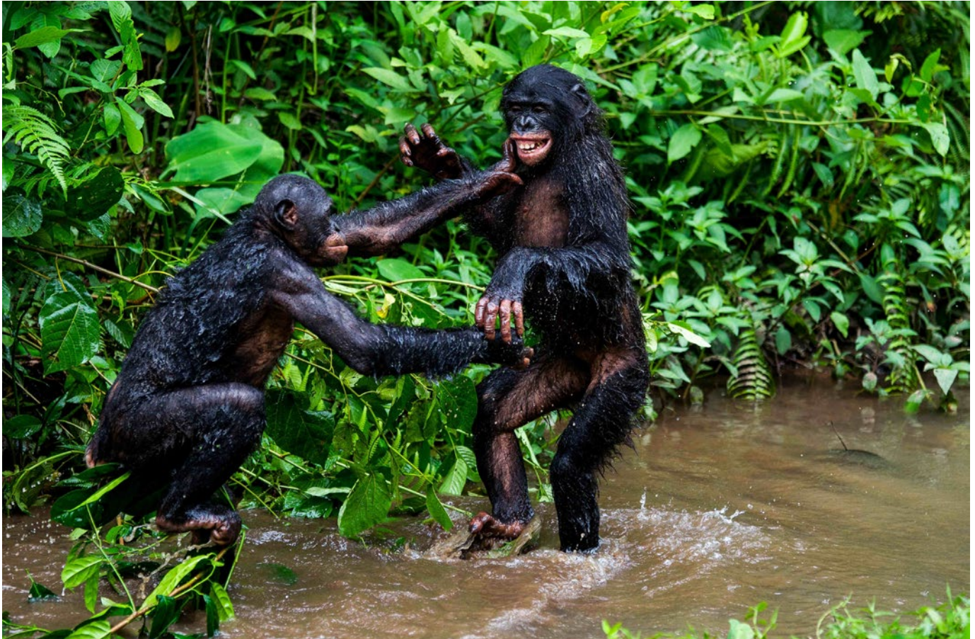
Jeu entre bonobos