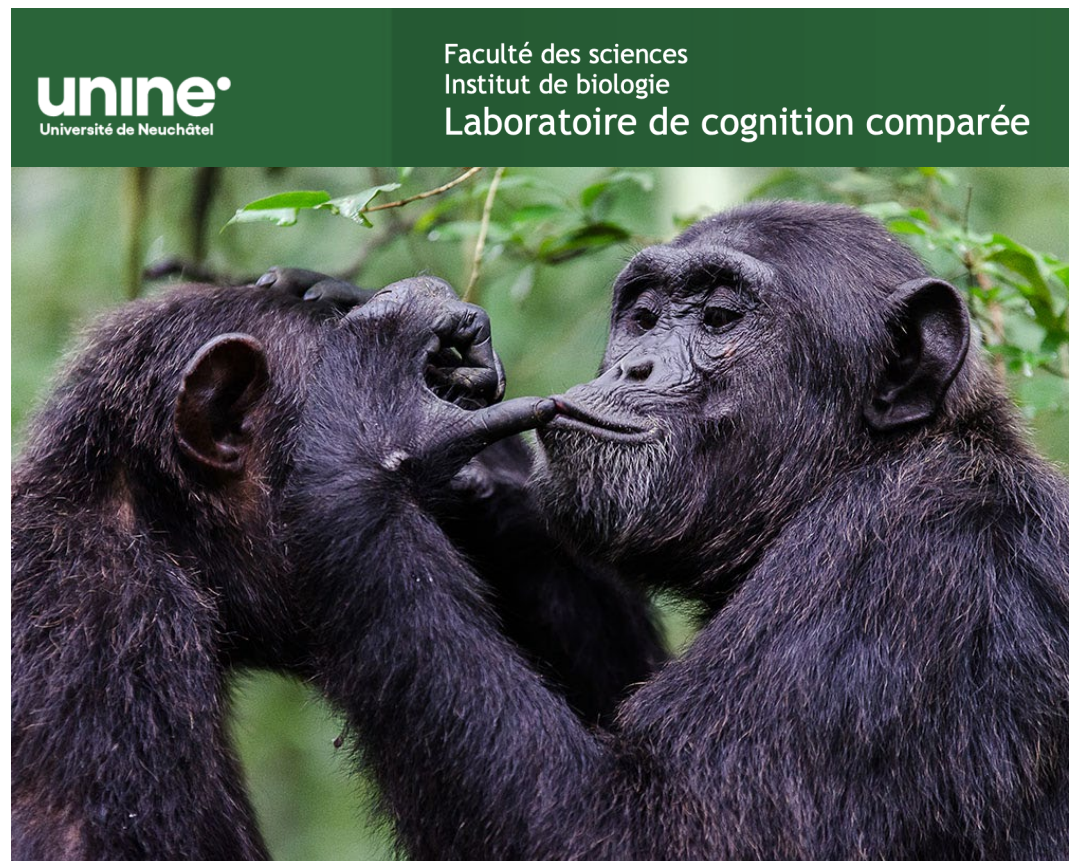
Epouillage entre chimpanzés

Imaginez-vous dans une salle de bal où vous vous apprêtez à inviter un partenaire à danser. Pour cela vous devrez respecter un certain protocole: choisir un partenaire, échanger un regard, vous approcher, tendre la main, vous assurer que l'autre accepte votre invitation, avant de débiter la danse et de synchroniser vos pas au rythme de la musique. Puis, une fois la danse terminée, sourire et remercier votre partenaire avant de vous séparer. Toutes ces étapes font partie des règles à res-