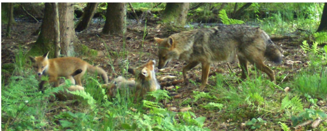
Un chacal doré interagissant avec une femelle renard roux et deux renardeaux roux (de droite à gauche).

Trente-deux observations avec les deux espèces apparaissant ensemble ont été enregistrées au cours de la période d'étude. Le comportement observé soulève des questions sur la coexistence des deux espèces et sur le comportement interspécifique des canidés sauvages en général. L'isolement social du chacal doré mâle observé pourrait être l'un des moteurs potentiels de l'interaction, car l'Allemagne se trouve actuellement à la limite de la distribution du chacal doré en Europe centrale.