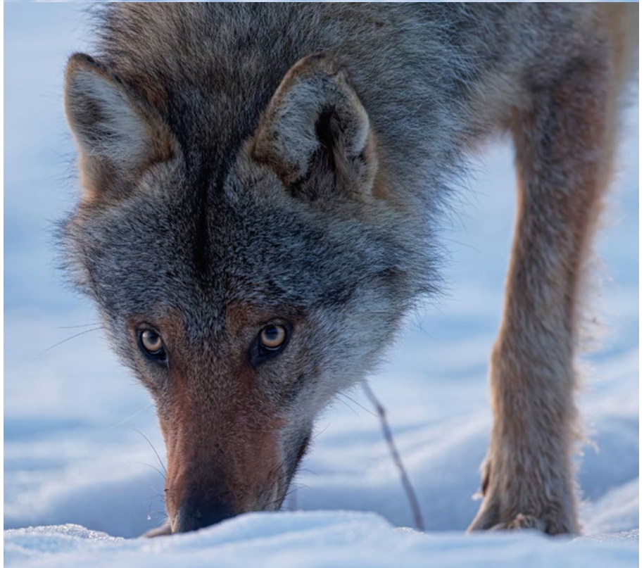
Loup finlandais