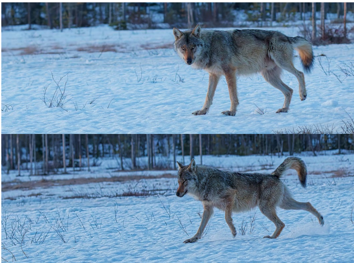
Séance de marquage avec l'urine et le grattage