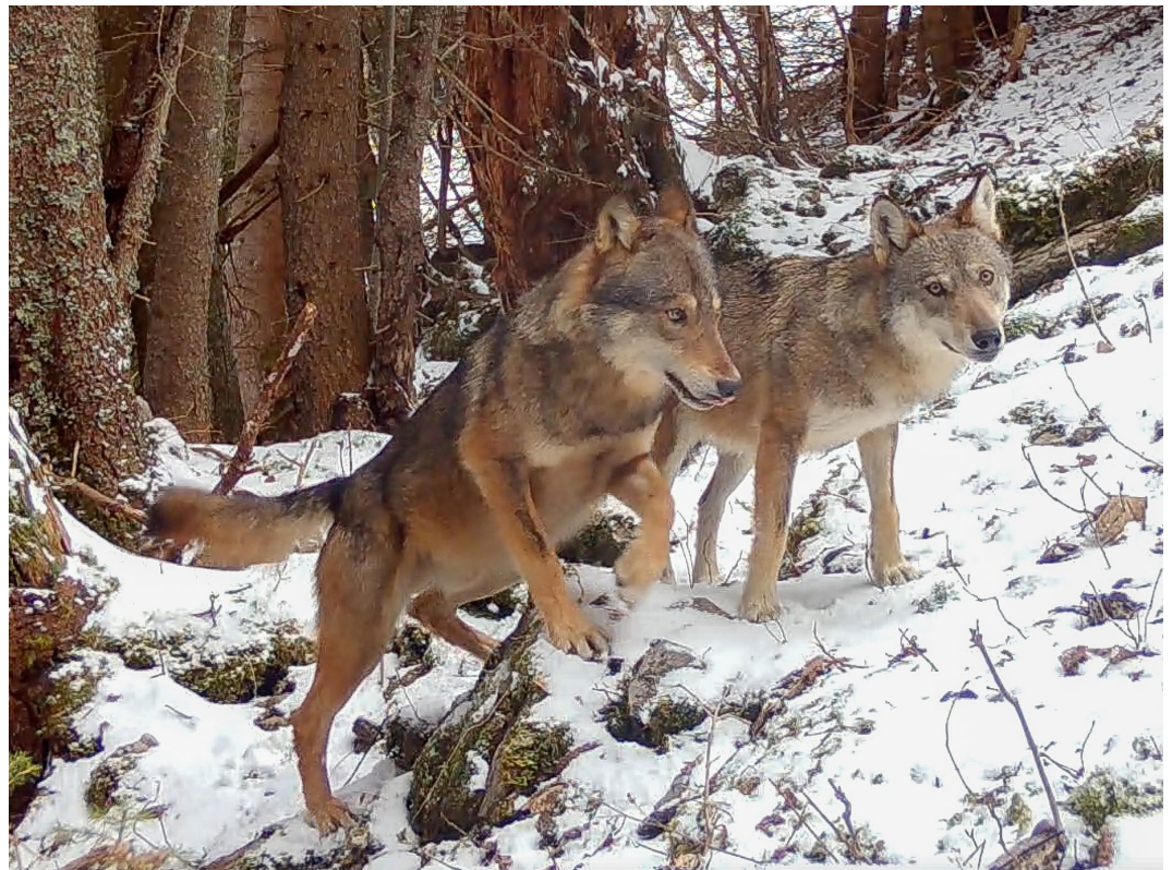
Couple de loups en Suisse, la femelle à droite, photo Stefano Pozzi

CH86 0900 0000 1201 3106 1 http://www.zool-ge.ch