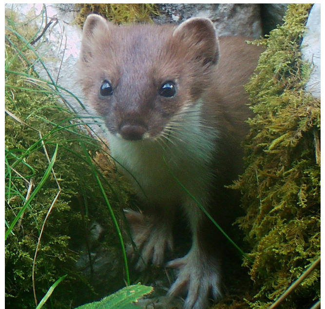
Hermine dans un mur de pierres sèches.

Ma présentation portera sur le rôle des murs de pierres sèches pour cinq espèces de mustélidés, dont l'hermine et la belette qui sont de précieux auxiliaires agricoles grâce à leur prédation sur les rongeurs constituant une menace pour les cultures. Les murs de pierres sèches, construits à l'aide de pierres naturelles et sans utiliser de liant, sont reconnus depuis plusieurs années comme des écosystèmes à part entière, jouant un rôle majeur pour la faune et la flore. Si l'on connaît bien leur importance pour les reptiles, mousses et lichens, elle reste peu connue pour les mammifères. En effet, bien que les spécialistes de terrain s'accordent à dire l'importance des murs de pierres sèches pour les petits mustélidés que sont l'hermine et la belette, peu d'études se sont réellement portées sur le sujet. Le rôle de ces murs pour d'autres espèces comme le putois, la fouine et la martre des pins est d'autant moins connu. Je vous présenterai donc mon projet, mené dans le canton de Neuchâtel en raison de son fort patrimoine mural, et mettrai en lumière son importance dans le cadre de la conservation de la faune, en particulier dans un contexte de réconciliation entre protection de la biodiversité et besoins de l'agriculture.