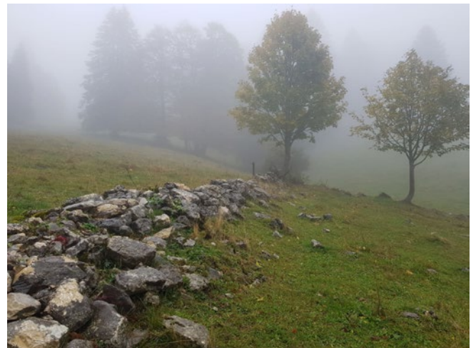
Mur de pierres sèches effondré.