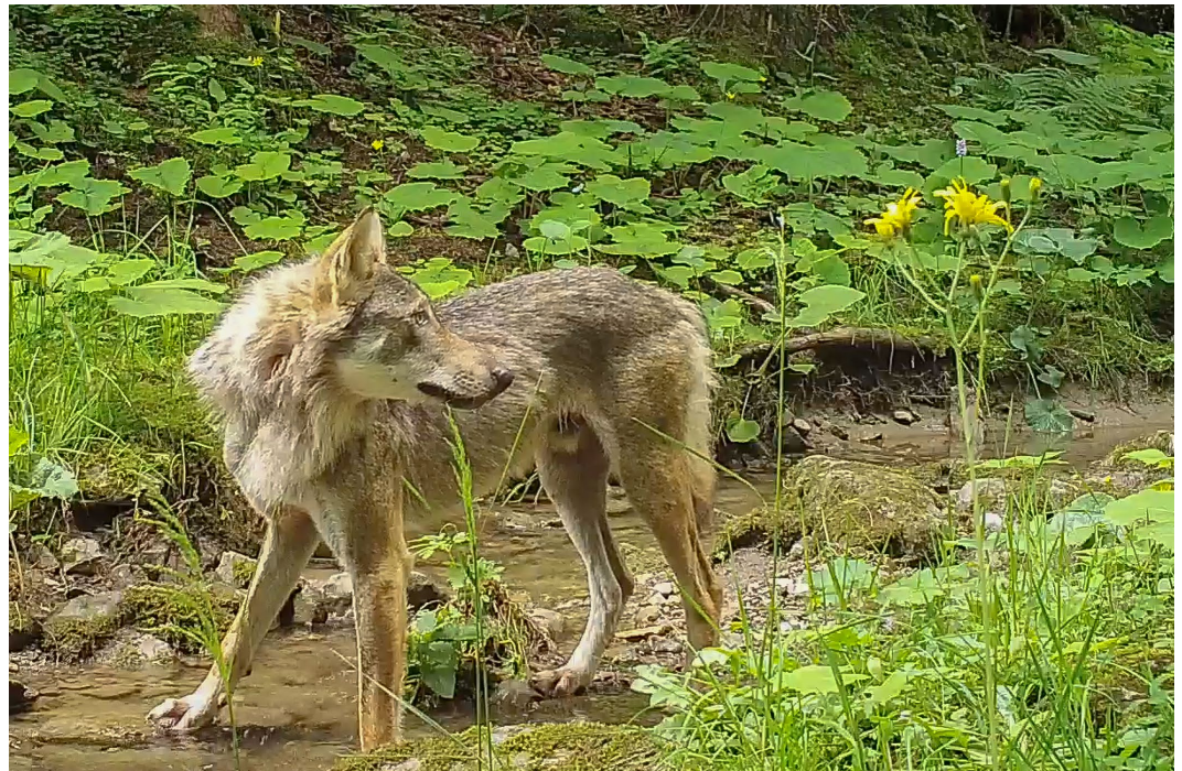
Loup en période estivale.

CH86 0900 0000 1201 3106 1 http://www.zool-ge.ch