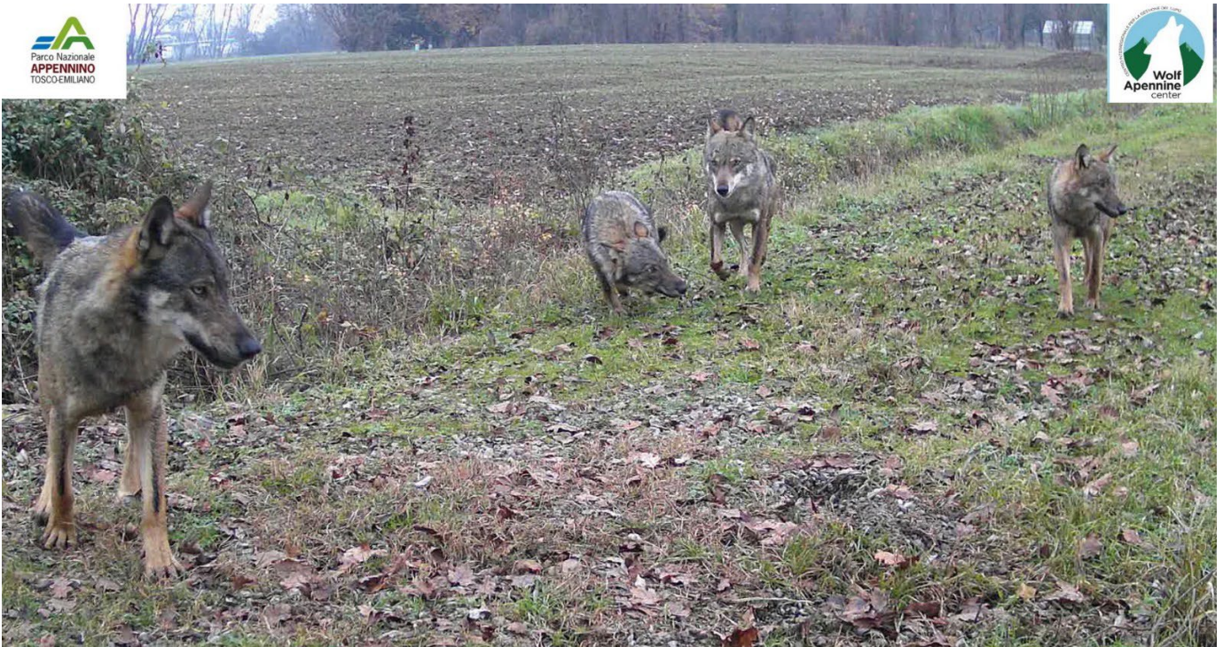
Noyau familial de loups dans la périphérie de Parme.

Les loups, grâce à leur capacité d'adaptation, vivent actuellement en Italie dans des zones très anthropisées comme la vallée du Pô, l'une des zones les plus urbanisées au monde. Ils vivent à la périphérie de villes telles que Parme, Reggio Emilia, Modène et Bologne. En particulier, seront montrées les images d'une famille de 6 loups qui fréquente actuellement un morceau de territoire au sein de la ville de Parme.