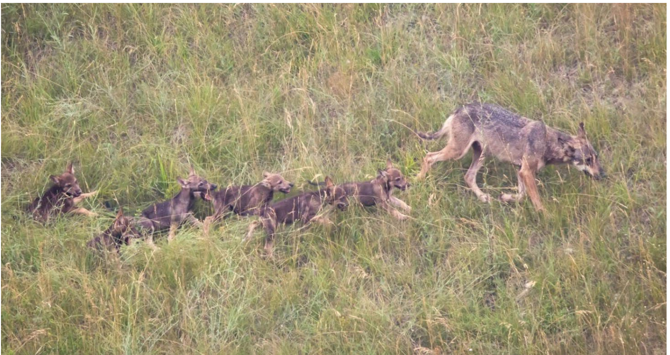
Louveteaux de quelques mois avec leur mère.