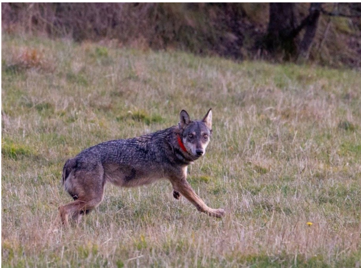
Louve au moment de sa libération après la mise en place du collier satellitaire.