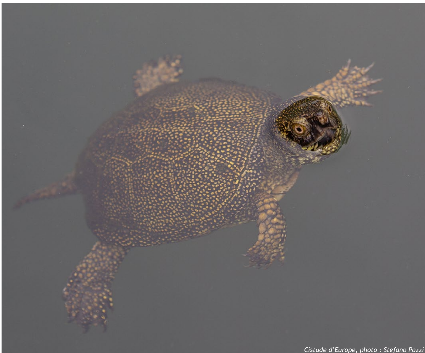
Cistude d'Europe

Le premier pilier est celui des humains. La biodiversité se conserve avec la population, par la connaissance, la sensibilisation, la transmission, le dialogue et l'engagement. Faire émerger une culture commune de la nature, nourrir l'intérêt et l'envie d'agir, soutenir les associations, partager les expériences et accompagner l'évolution des regards font pleinement partie du travail. Dans un canton où la nature côtoie de très près les lieux de vie, les espaces de loisirs et les activités agricoles, cette dimension humaine est omniprésente.