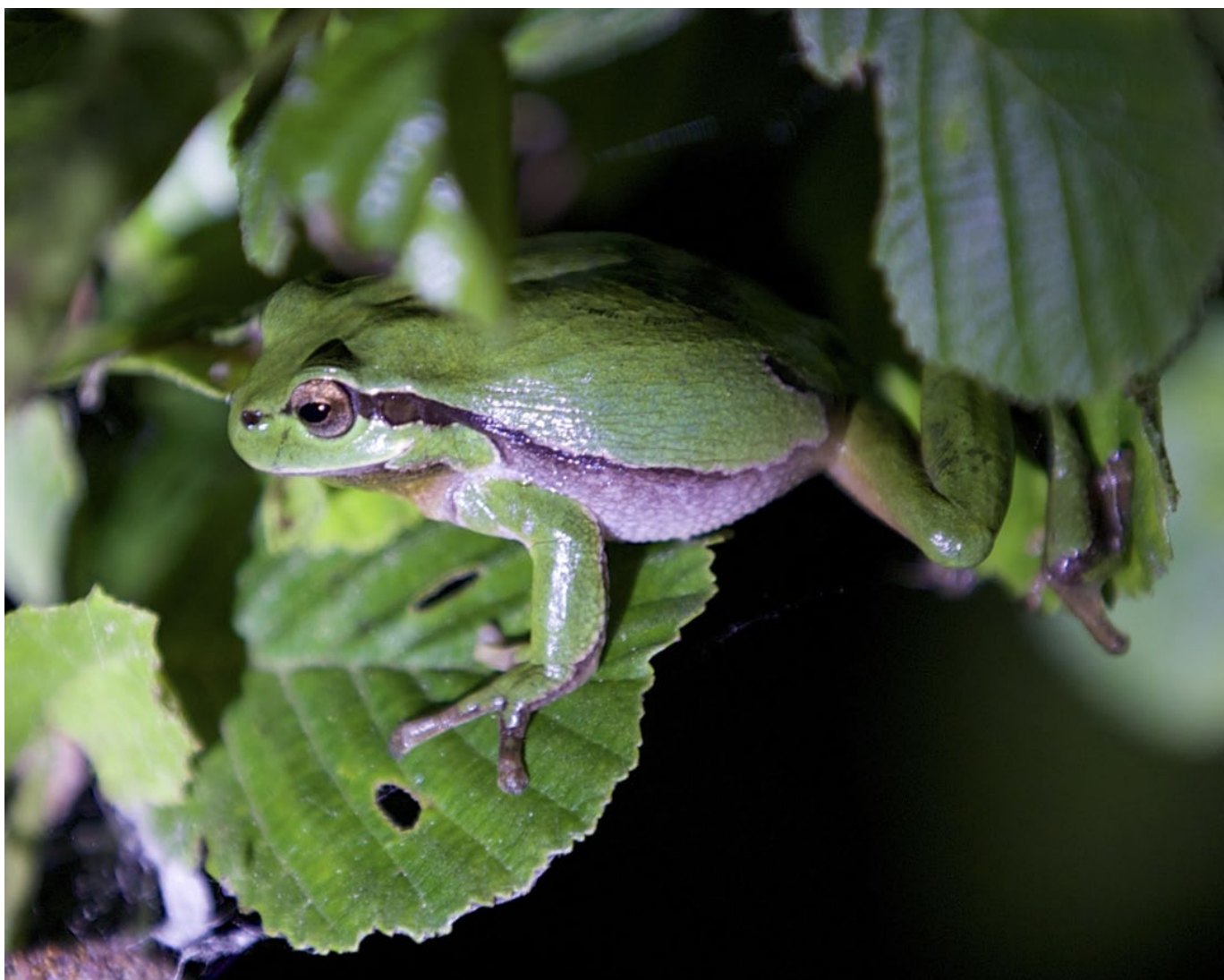
La rainette verte n'est plus présente dans le canton de Genève. Sera-t-elle de retour un jour ?